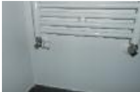
▲ Absence de dispositif de réglage du chauffage