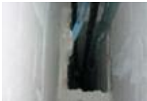
▲ Absence de recoupement