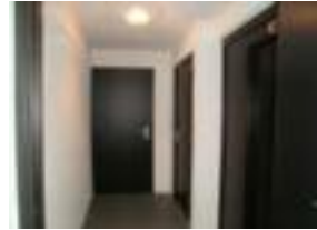
▲ Absence de revêtement absorbant dans les circulations communes