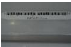
▲ Mortaise inadaptée