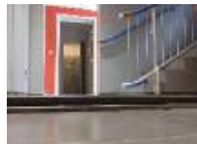
▲ Ressaut sur circulation