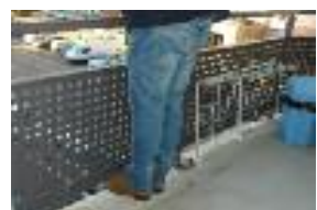
▲ Hauteur inadaptée