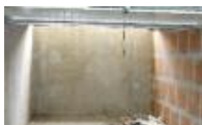
▲ Ventilation haute d'un parc en fond de box