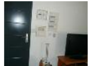
▲ Hauteur commande inadaptée