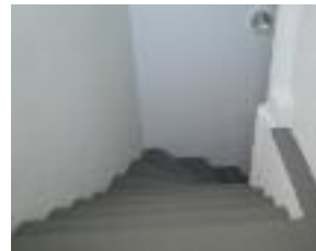
▲ Absence de marquage